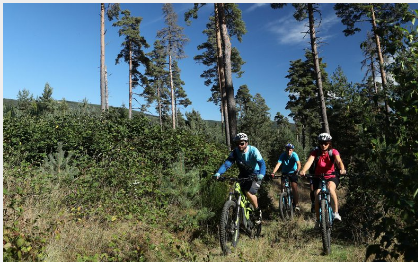
Randonneurs à VTT sur les chemins