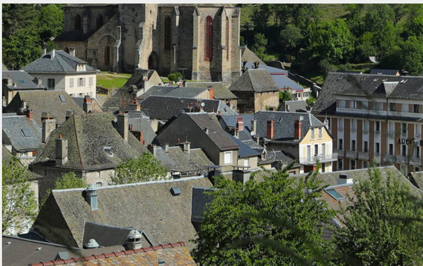
L'écrin du village de Chaudes-Aigues