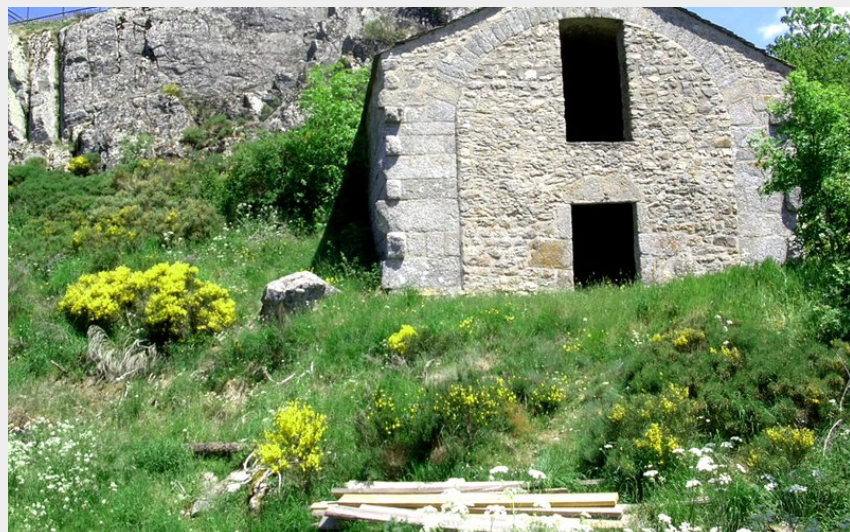
Rocher du Cher