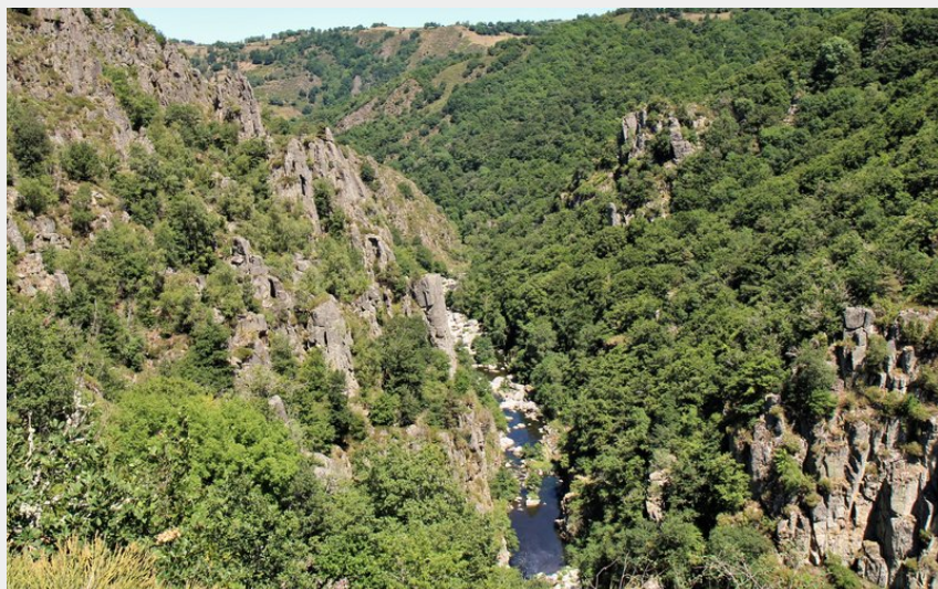
Sentier des espagnols