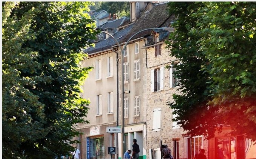
Le pont sur le Remontalou