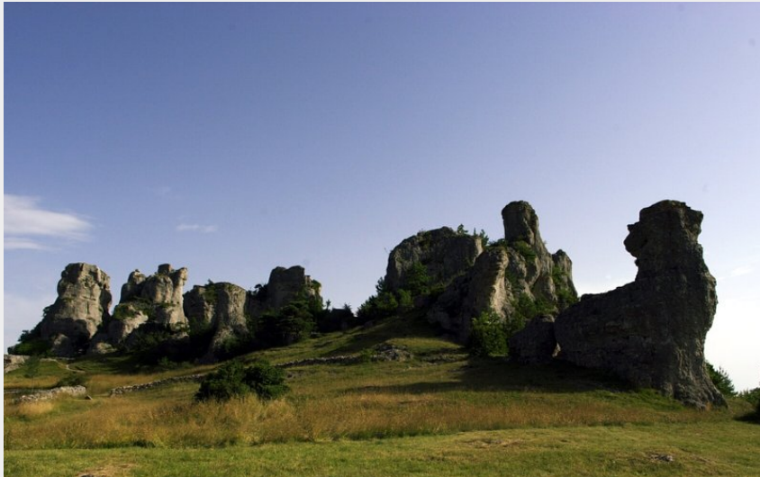
Corniches du Rajol (Communauté de Communes Millau Grands Causses )