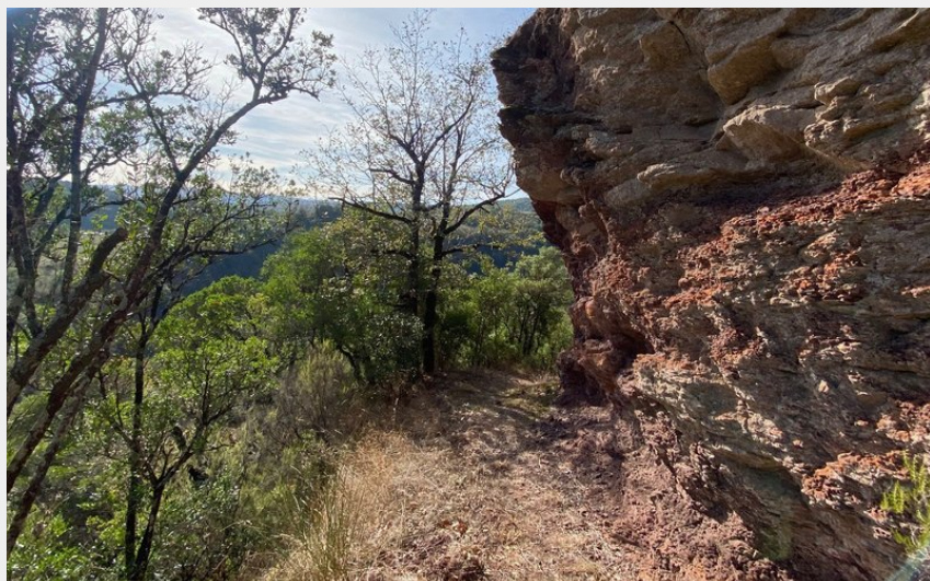
Falaises de Luz (E.Genty)