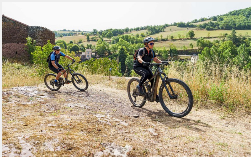
VTT Combret haut du village