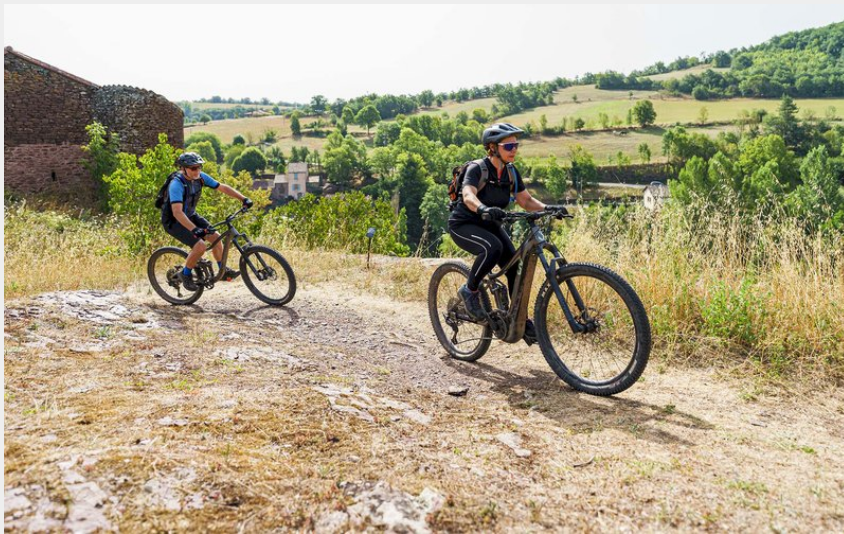
VTT Combret haut du village