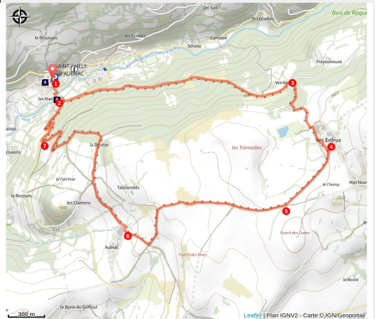
En dépassant le village de Saint Chély d'Aubrac

Enjamber le Pont des Pèlerins à St Chély d'Aubrac pour une randonnée de 2 heures, qui emprunte sur une partie l'ancienne Voie Romaine !