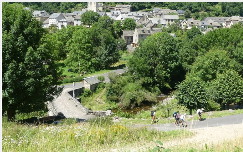
En dépassant le village de Saint Chély d'Aubrac