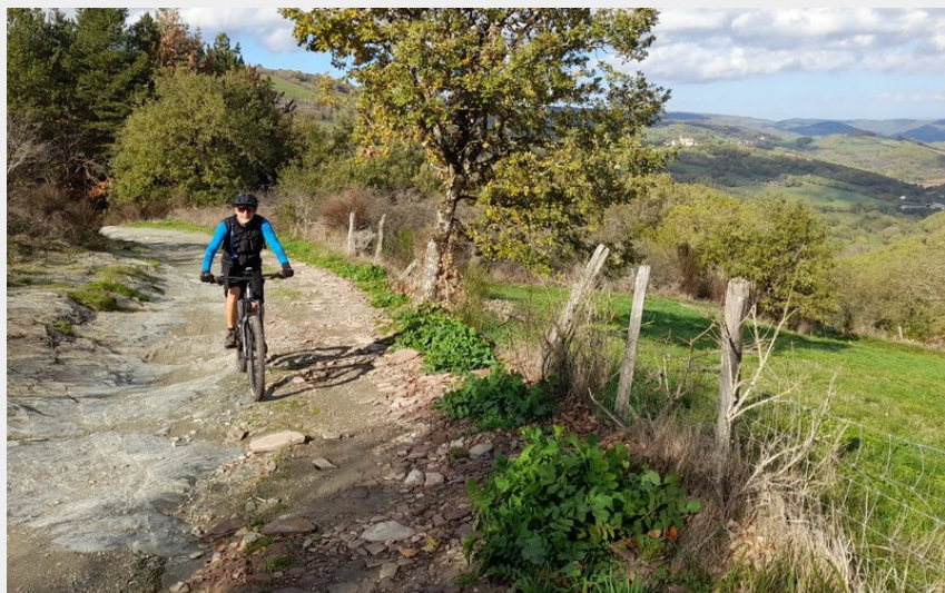
Crêtes de Roquecézière (N.Nespoulous)