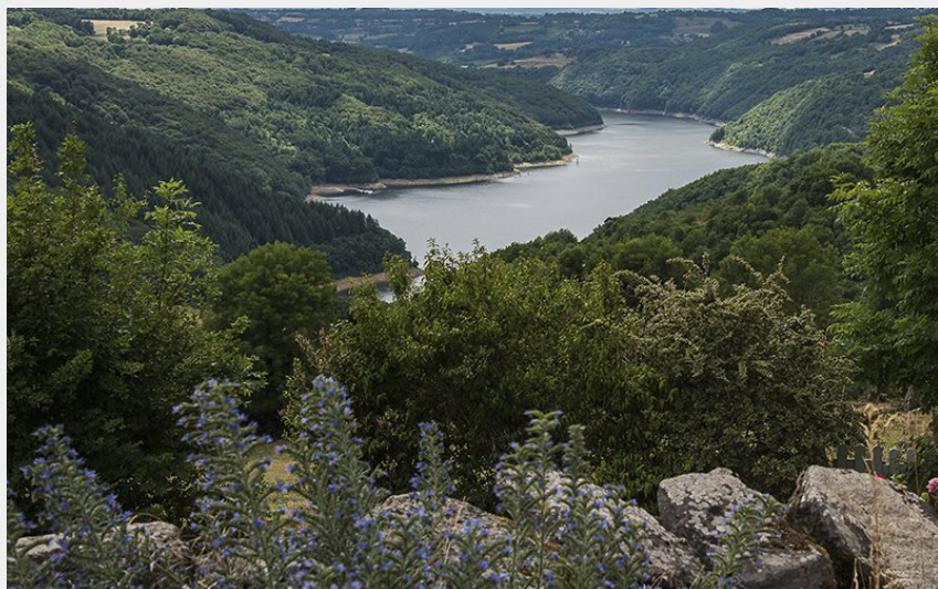
Le lac de Sarrans et ses 1000 hectares