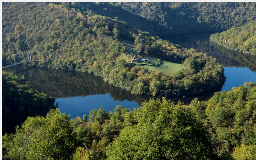
Un méandre de la Truyère