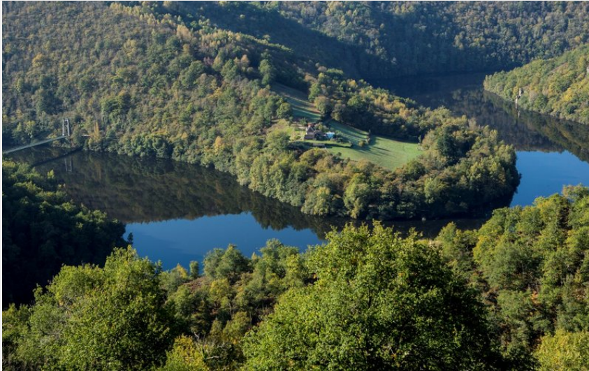
Un méandre de la Truyère