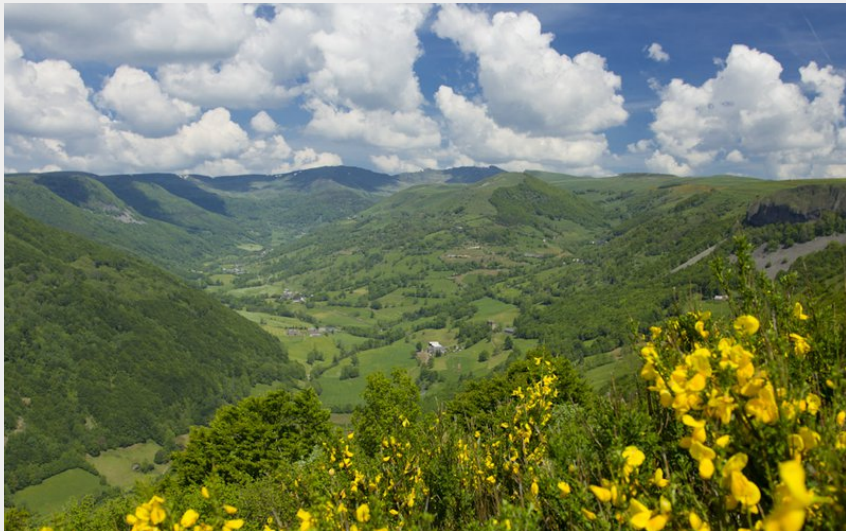
La vallée du Brezons (Hervé Vidal)