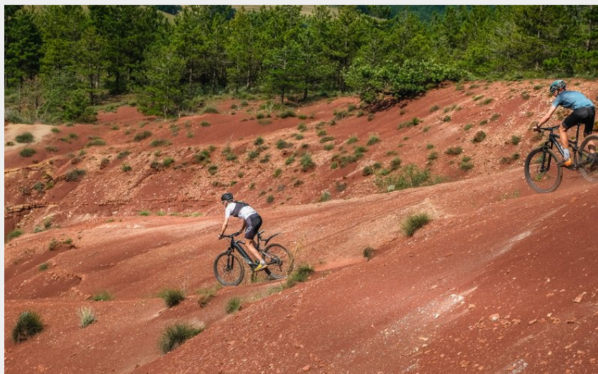
Au cœur du Rougier (V.Govignon)