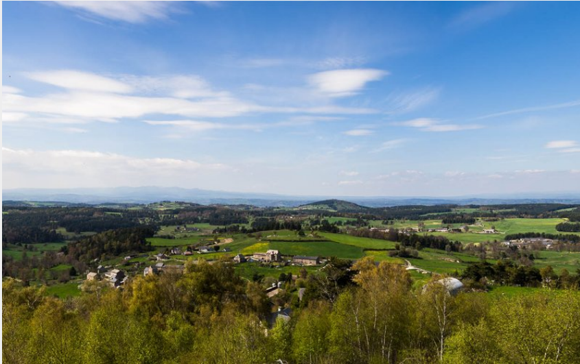
Point de vue sur le Plomb du Cantal