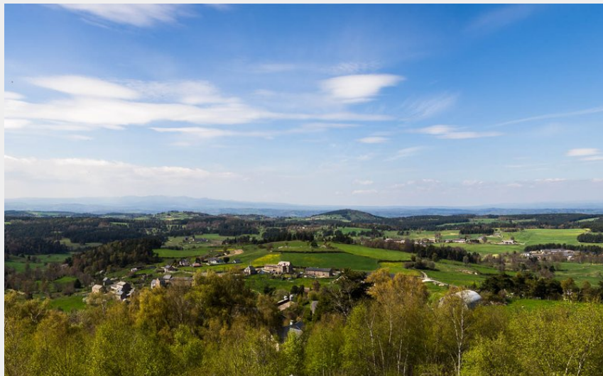
Point de vue sur le Plomb du Cantal