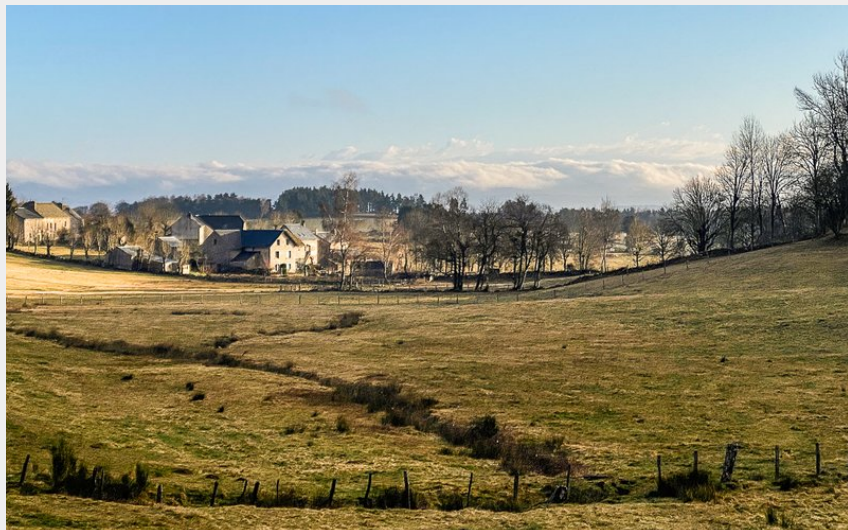
Le Puech-del-Mont