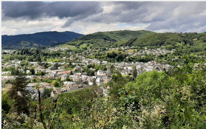
Vue sur la randonnée des Vaysseries