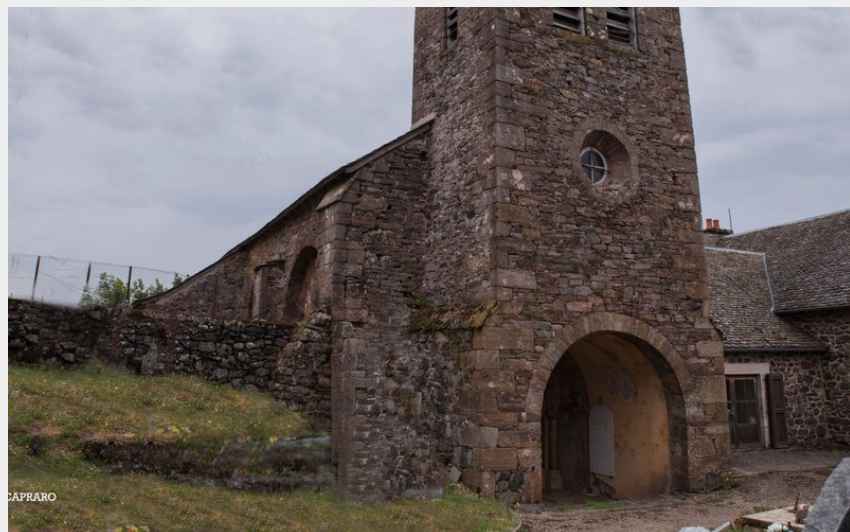
L'Eglise de Verlac