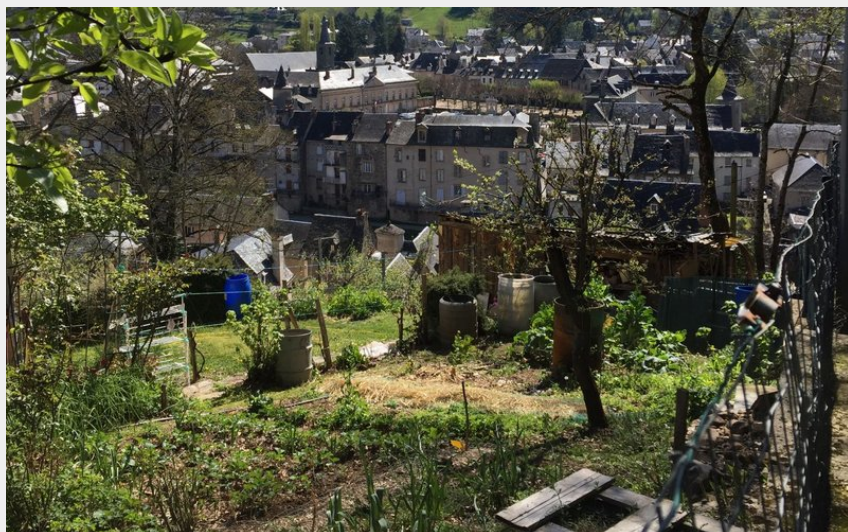
Point de vue - Barribès