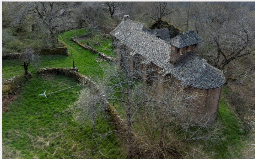
Chapelle d'Aurelle