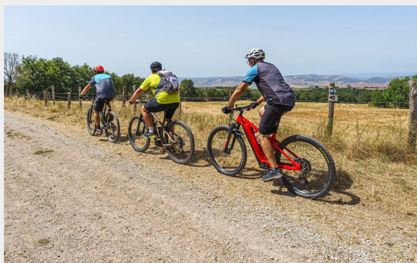
VTT Belmont-Montlaur