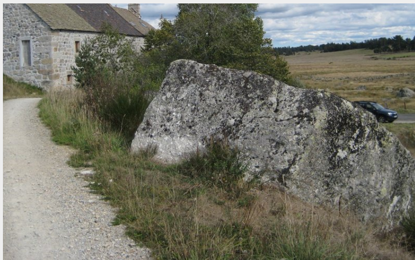
Les roches de granit à côté du Moulin de la Folle