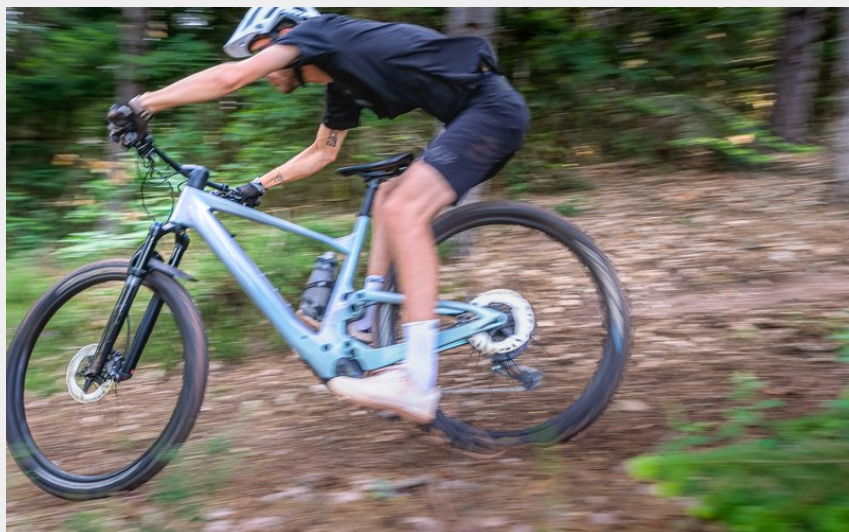
Pistes du Maliver (V.Govignon)