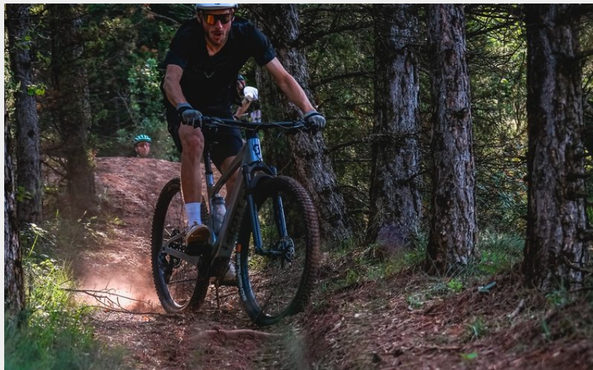
La forêt de St Thomas (V.Govignon)