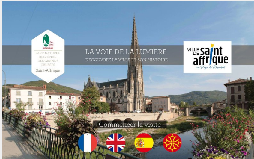
La voie de la Lumière - Saint-Affrique