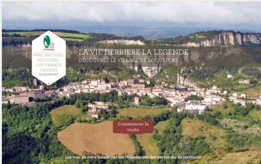
La vie derrière la légende