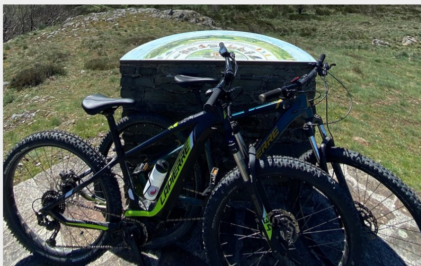
Sommet du Merdelou (E.Genty)