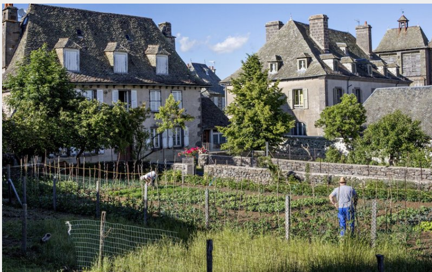
Le village de Thérondels