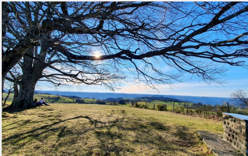
Vue à 360°C au Puy de Montabès