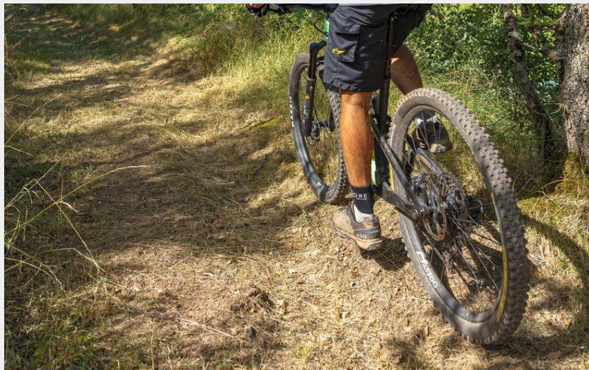
VTT Belmont-sur-Rance