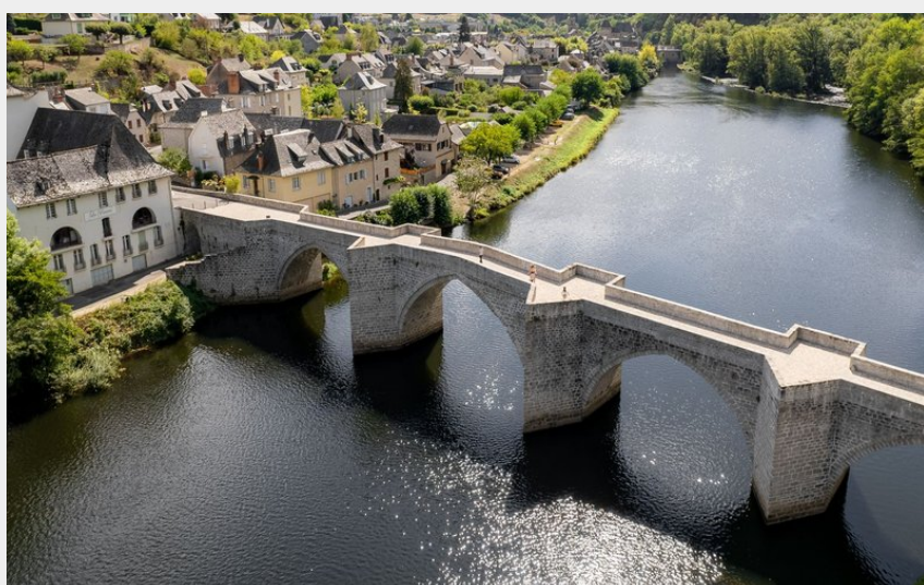
Le pont de la Truyère à Entraygues