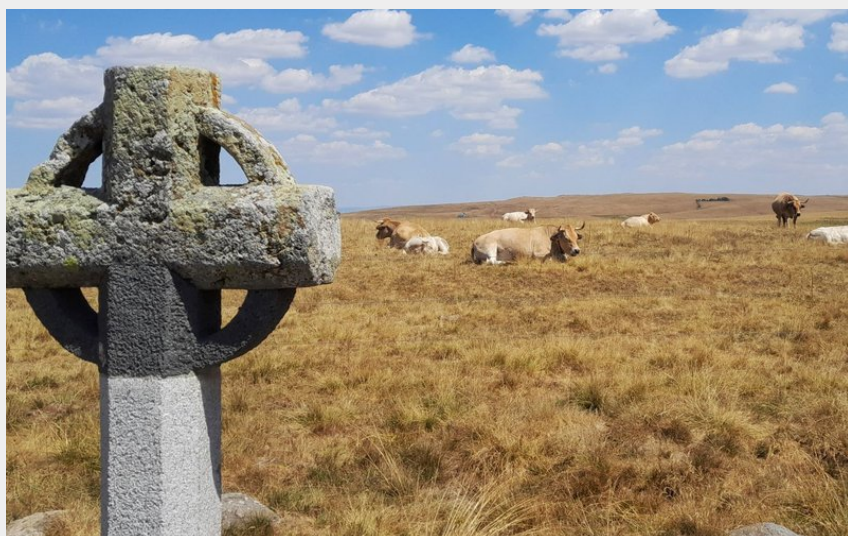
Croix de la Rode