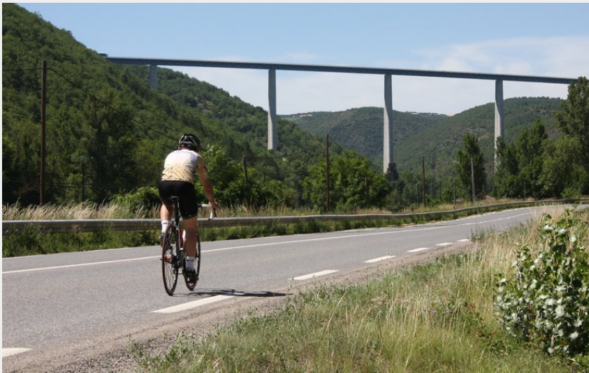
Viaduc de Verrières