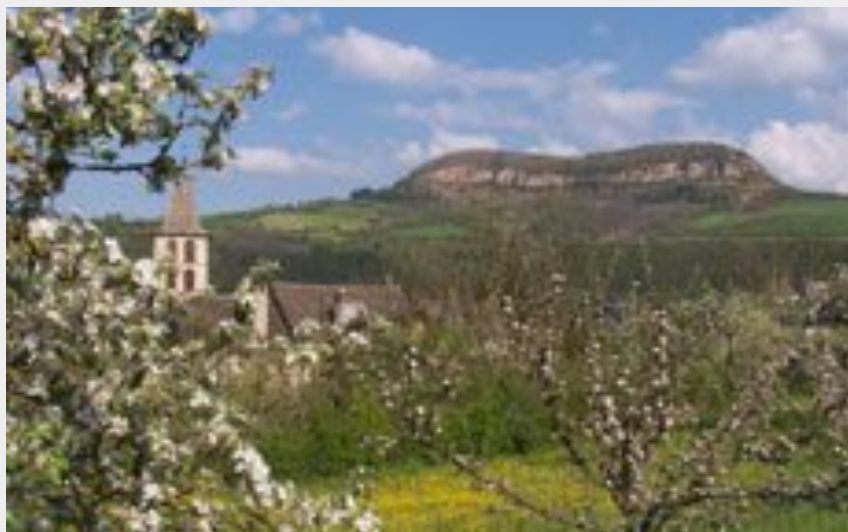
Le Truc de St bonnet