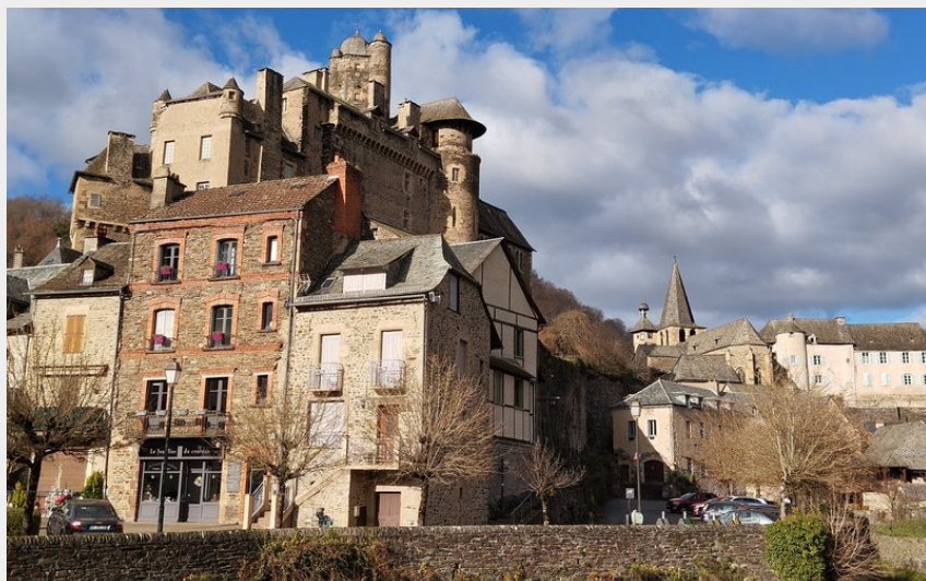
Le château d'Estaing