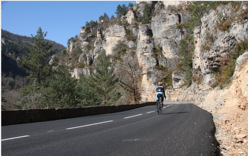
Gorges de la Jonte (@Y.Blanc)