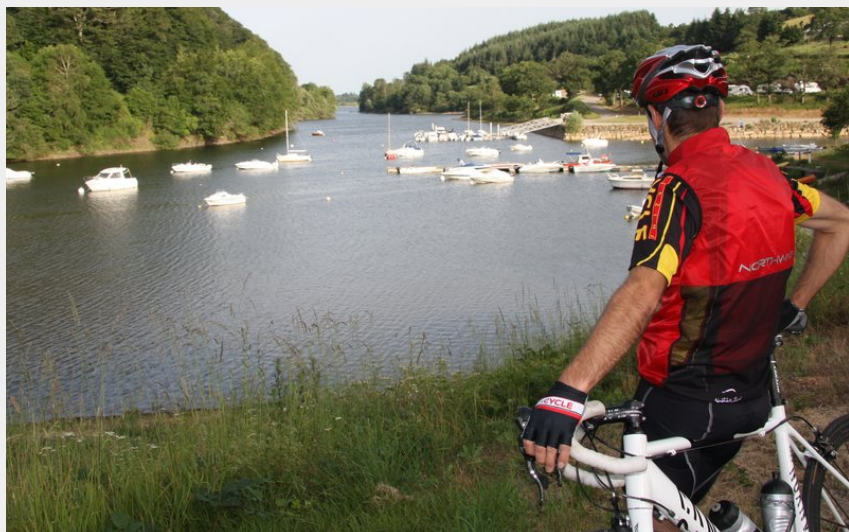
Vue sur les lacs de Lévézou