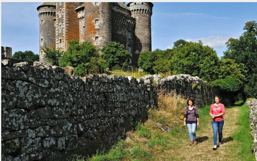
Le Château du Bousquet, monument historique du XIV ème siècle