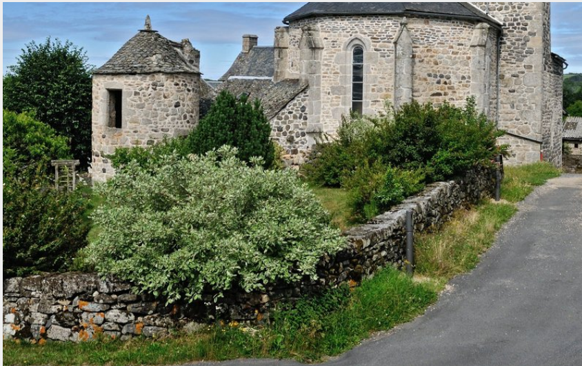
Eglise XVème siècle de Soulagès-Bonneval (A. Mérévilles. Tourisme en Aubrac)