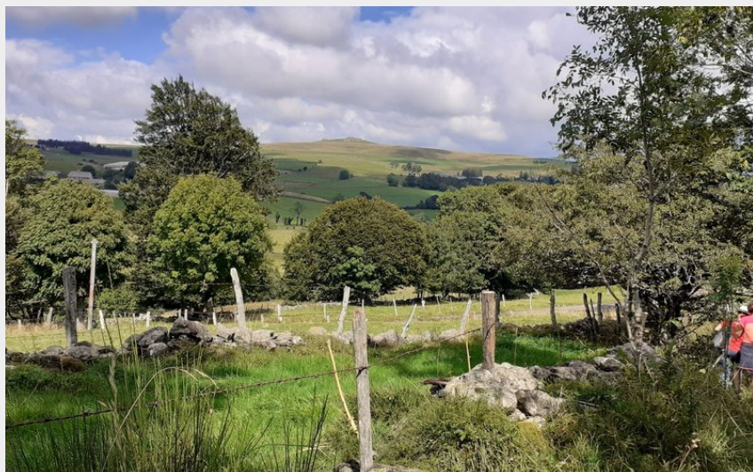
Point de vue Roc du Cayla