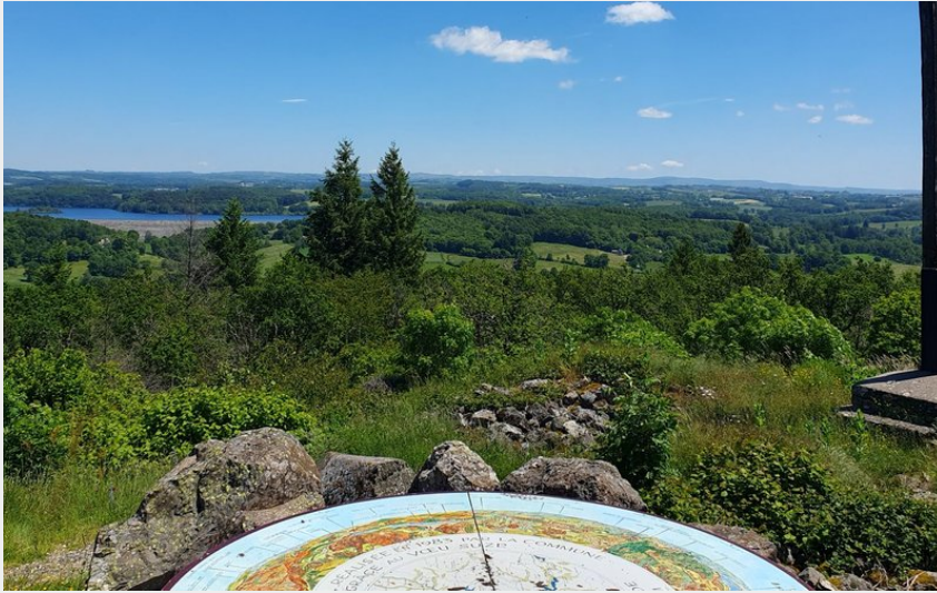
Le pic du Castel et sa vue à 360°