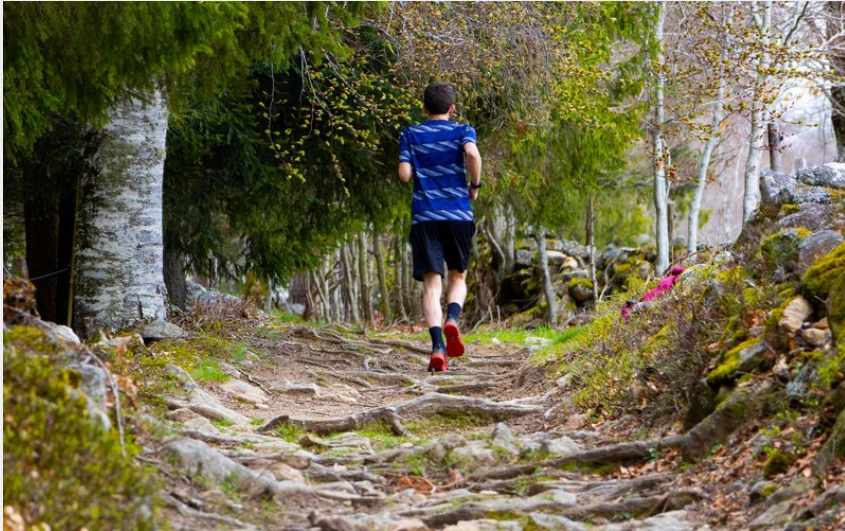
Montez en altitude !