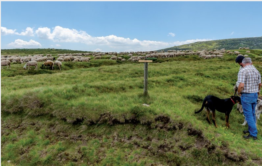
Transhumance Mont Lozère (cabane de Mas Camargue)