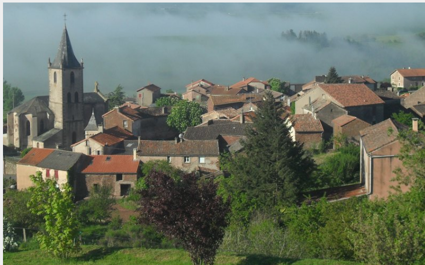
Village de Rebourguil (LaureBarthelemy)