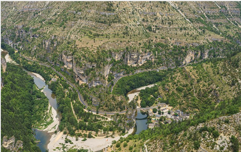
Virage St-Chély-du-Tarn