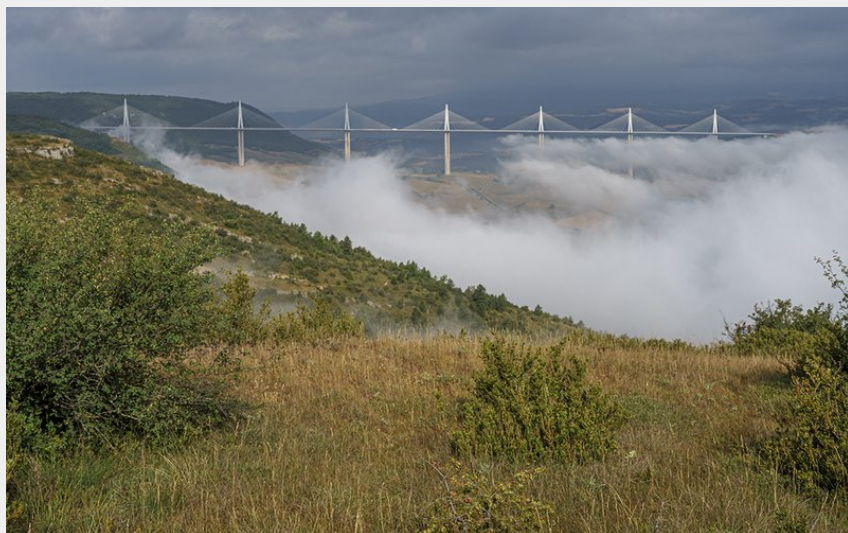
Viaduc depuis Brunas