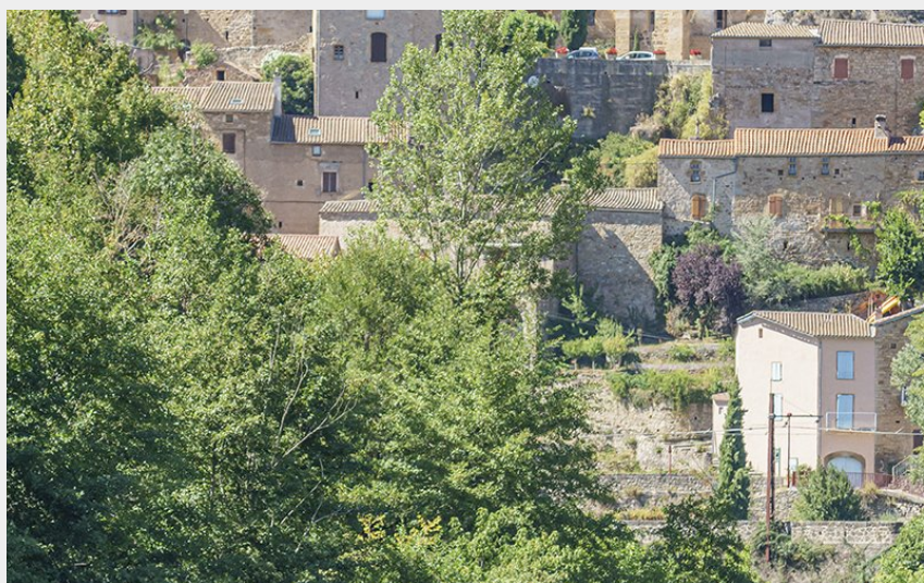
Bateliers village de Peyre