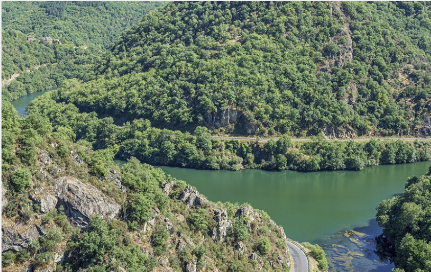
Rases du Tarn depuis Ayssènes